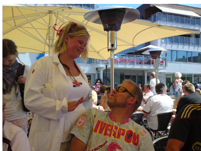
Hmm☺Utdringslag er moro!