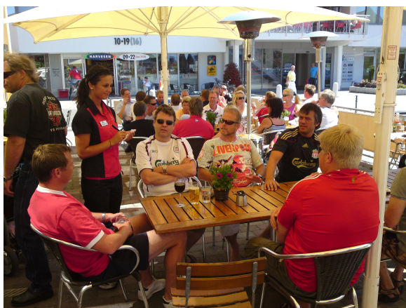
Søte servitører og godt og kaldt øl☺

Utover dagen ble det lunch i Lyngdal sentrum og inntak av iskaldt øl på Jonas☺