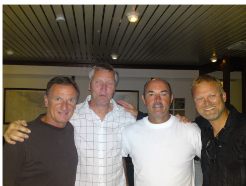
I baren før kampen: Phil Thompson, Visepresidenten, Bruce Grobelaar og Presidenten. Et stort