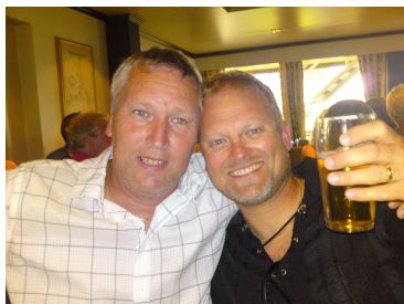
Visepresidenten og Presidenten ser ut til å hygge seg☺!