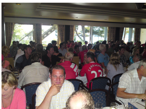
200 stk. til middag, topp stemning og god mat☺.